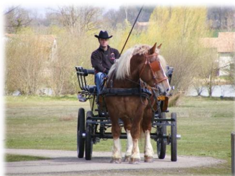
Rosco, cheval de trait breton attelé à notre calèche