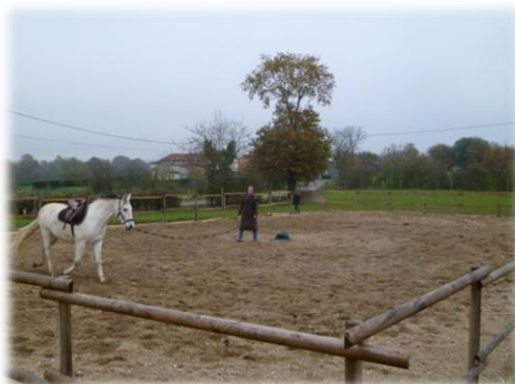
Travail en longe dans notre carrière